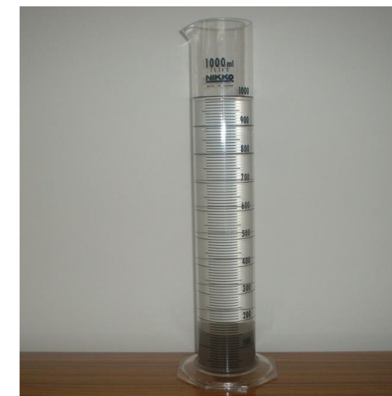
ダクスイエース添加・攪拌後の処理水