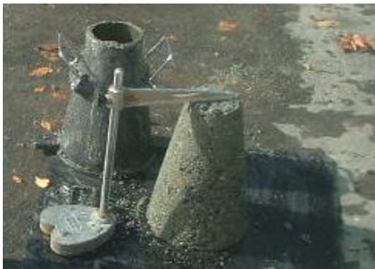
加泥材添加前 (地山の状態) SL=0cm