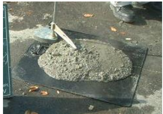
アルカゲルスーパー (10kg/m 3 配合)