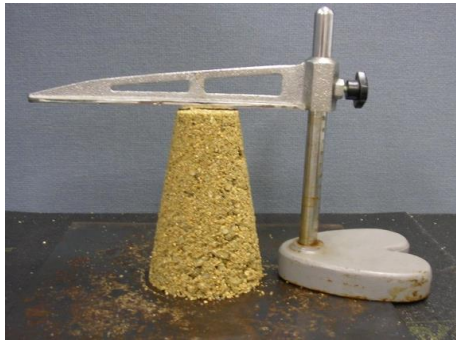
透水係数の高い砂礫 (細粒分3.0%)