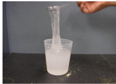
アルカゲルプレミアの高い粘性 (5kg/m 3 配合)