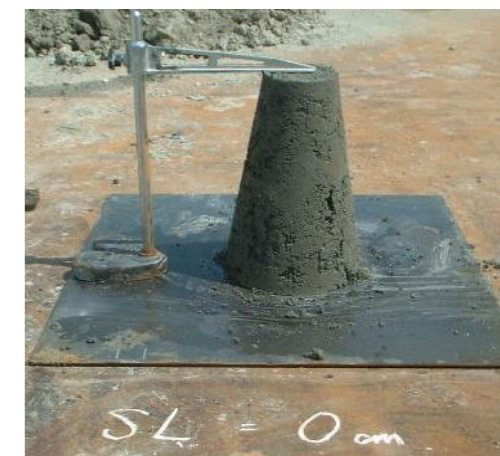
改質後（スランプ値：0.0cm）