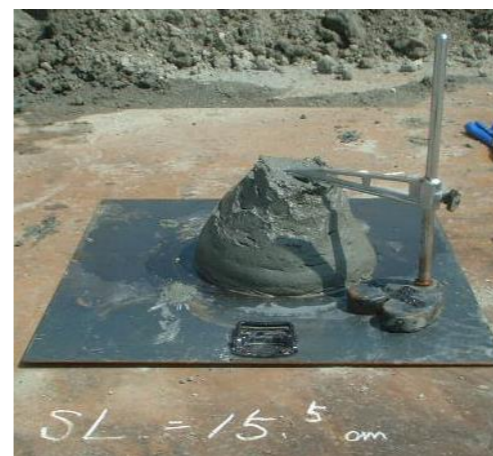
改質前（スランプ値：15.5cm）

泥土改質剤アルカスーパーロックは、溶液タイプの泥土改質剤です。流動性の高い含水比の高い土砂（掘削残土・浚渫土など）に添加・混合することで、土砂中の細粒分を団粒化させ流動性の低い土砂に改質することができます。